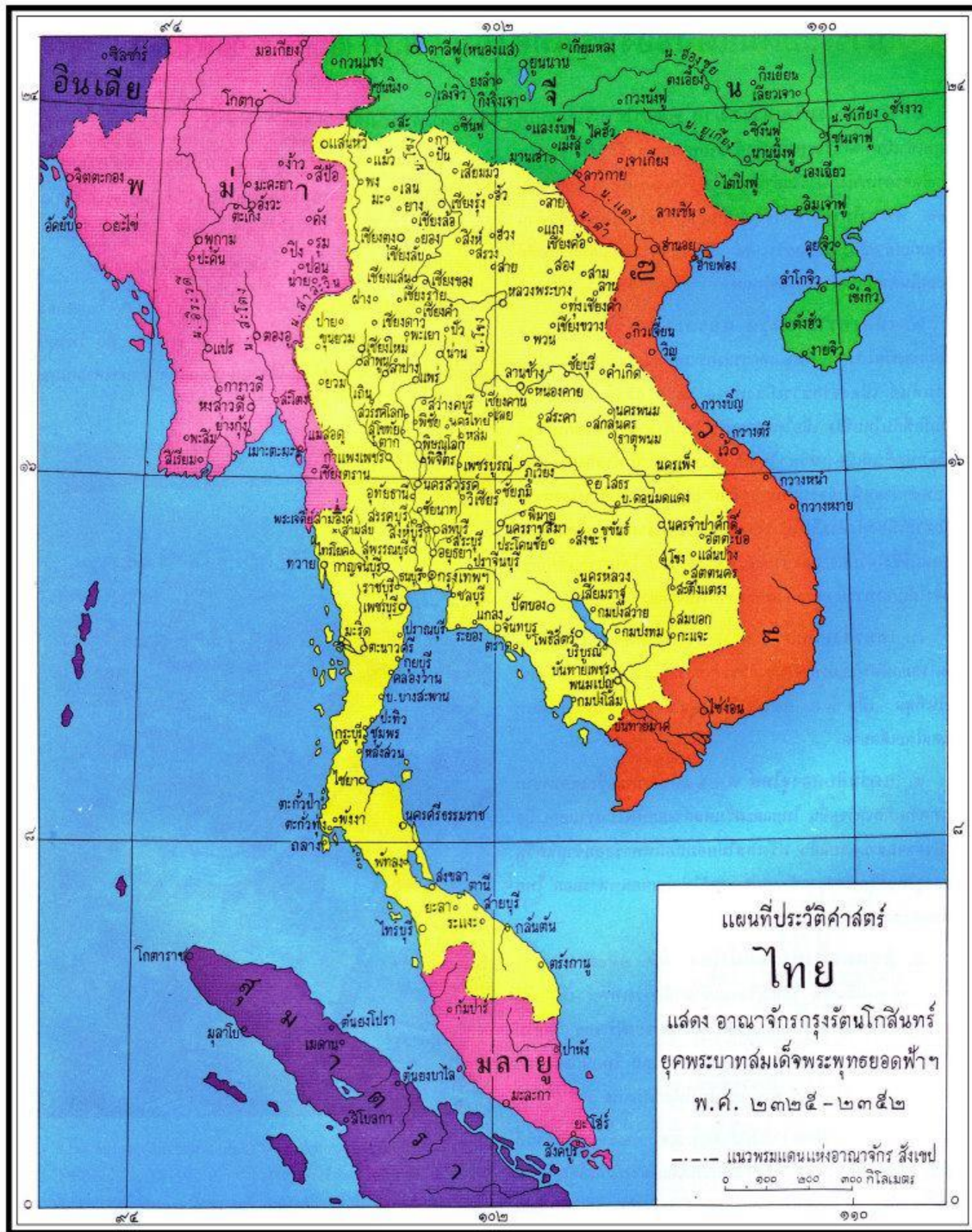
รูปที่ 2 แผนที่ประวัติศาสตร์ไทยแสดงอาณาเขตสมัยรัตนโกสินทร์ ฉบับทองใบ แดงน้อย