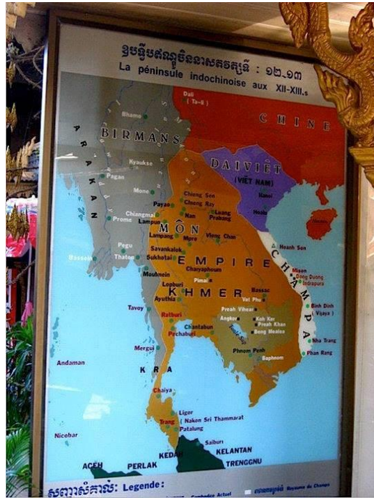
รูปที่ 4 แผนที่ประวัติศาสตร์แสดงอาณาเขตของอาณาจักรพม่า (ช้าย) และ เขมร (ขวา) ที่มา: แผนที่ราชชาตินิยมอุษาคเนย์ (ดุยกภาค ปรีชาธิชช, 2558)