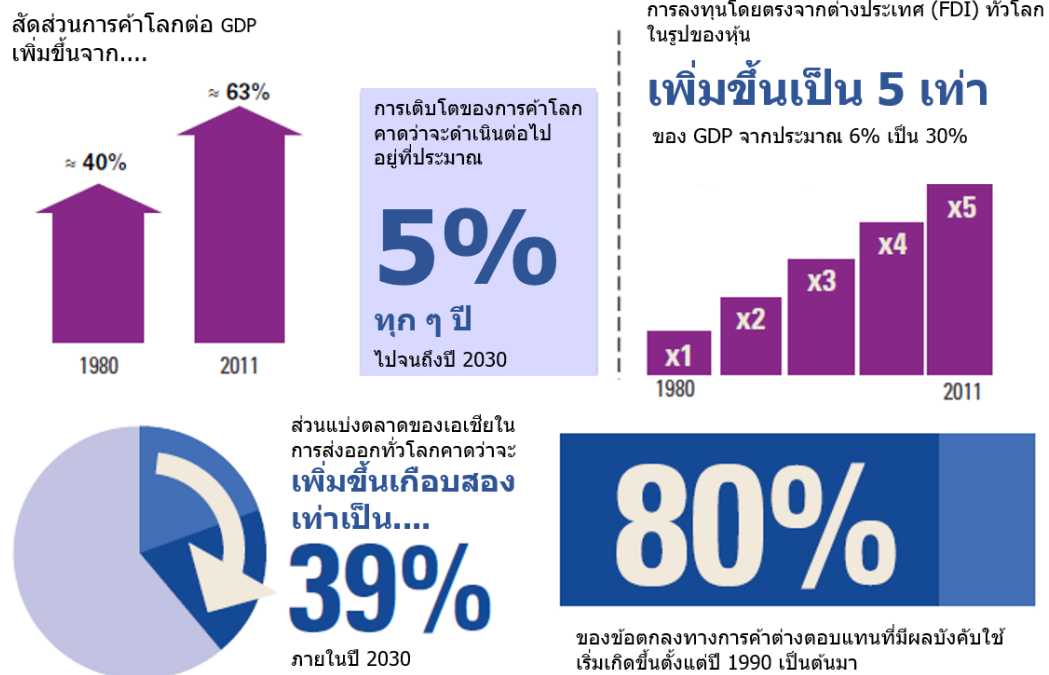
ภาพที่ 2 แนวโน้มการเปลี่ยนแปลงด้านการค้าและการลงทุน