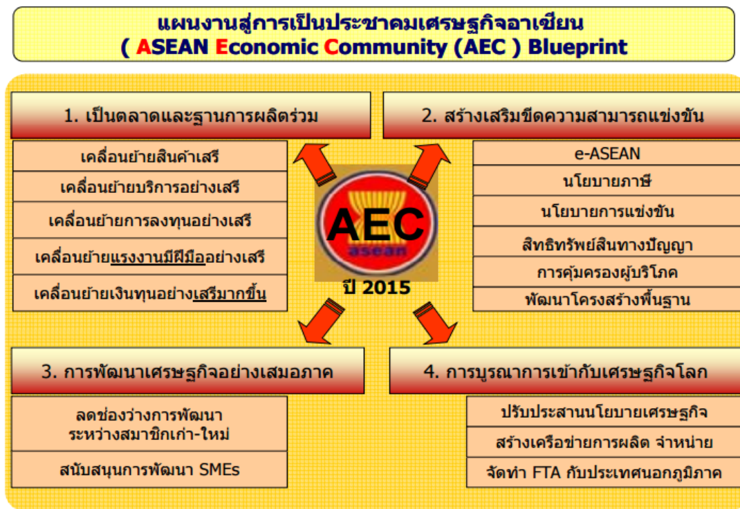
ภาพที่ 3 แผนงานสู่การเป็นประชาคมเศรษฐกิจอาเซียน